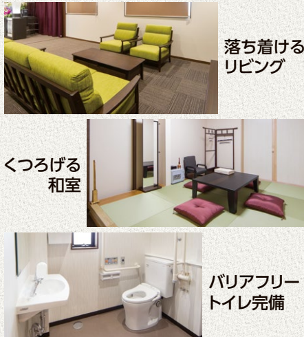
落ち着けるリビング